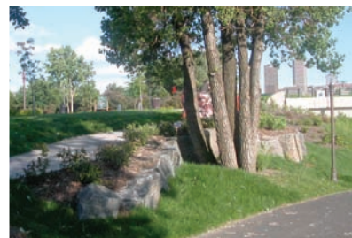
PARC DU VIEUX-PASSAGE, VILLE DE QUÉBEC