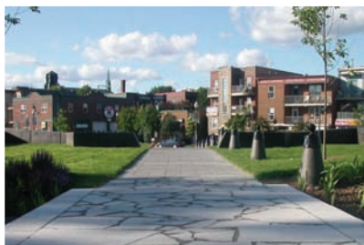
PARC DU VIEUX-PASSAGE, VILLE DE QUÉBEC