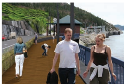
QUAI DE CROISIÈRES, BAIE-SAINTE-CATHERINE