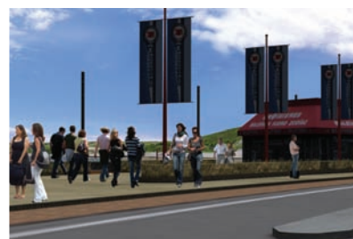
QUAI DE CROISIÈRES, BAIE-SAINTE-CATHERINE