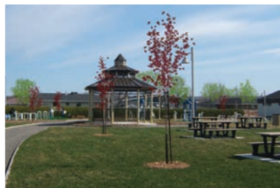
PARC DES AÎNÉS, LA POCATIÈRE