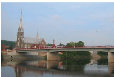
ROUTE 216 ET APPROCHES DU PONT, SAINTE-MARIE-DE-BEAUCE