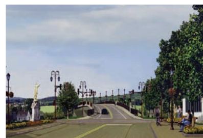
ROUTE 216 ET APPROCHES DU PONT, SAINTE-MARIE-DE-BEAUCE