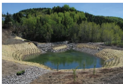
PROJET DE COMPENSATION DE L'HABITAT DU POISSON, GASPÉ (L'ANSE-À-FUGÈRE)